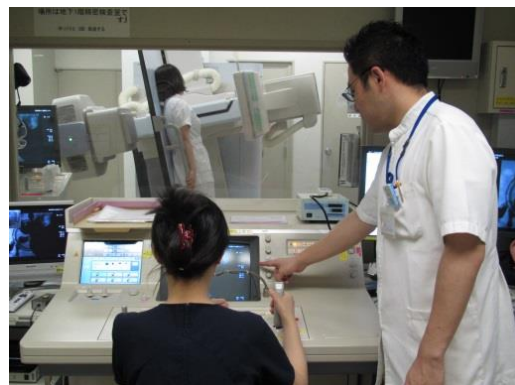
撮影シミュレーションの様子