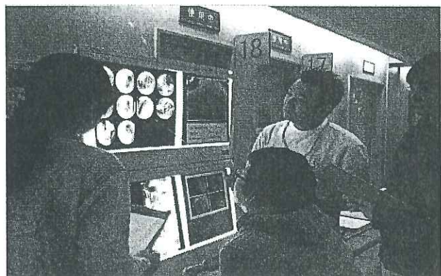
検診症例読影実習